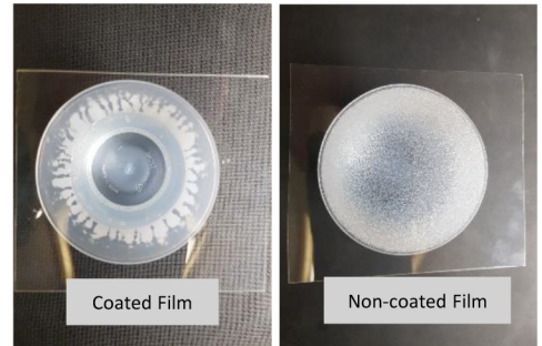
Steam Test - 80°C Hot water